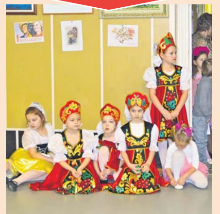
В досуговом центре «Гагаринец» состоялся праздничный концерт к 8 Марта