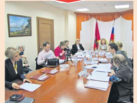
Состоялись заседания Совета депутатов муниципального округа Гагаринский

Указ об учреждении Дня местного самоуправления Президент России Владимир Путин подписал 10 июня 2012 года. Как говорится в документе, он вводится «в целях повышения роли и значения института местного самоуправления, развития демократии и гражданского общества». Датой праздника было решено установить 21 апреля – день издания в 1785 году Жалованной грамоты городам, подписанной Екатериной II. «Грамота» положила начало российскому законодательству о местном самоуправлении. Дальнейшее его развитие было связано с земской и городской реформами Александра II. Положение о земских учреждениях 1864 года ввело выборные губернские и уездные земские собрания, которые заведовали местными хозяйственными делами. С 1870 года органами городского самоуправления стали городские думы и управы. Конституция РФ, принятая в 1993 году, закрепила самостоятельность местного самоуправления. Его реформирование и развитие продолжается и по сей день. Сегодня на органы местного самоуправления возложена большая ответственность за социально-экономическое развитие территорий, создание комфортных условий для проживания горожан. Этот праздник призван еще раз напомнить жителям, что все мы ответственны за район, в котором живем. Сделать его лучше, чище и красивее – наша общая задача.