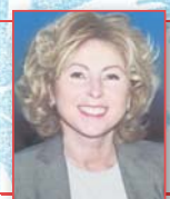
ГРАФИК ПРИЕМА НАСЕЛЕНИЯ ДЕПУТАТАМИ СОВЕТА ДЕПУТАТОВ МУНИЦИПАЛЬНОГО ОКРУГА ГАГАРИНСКИЙ В I КВАРТАЛЕ 2016 ГОДА