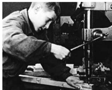
Кружковец в столярной мастерской. Фото из фондов Музея истории детского движения ГБПОУ «Воробьевы горы».

Несмотря на все сложности, Дом пионеров работал и во время Великой Отечественной войны (1941–1945). В основном действовали кружки, которые могли помочь фронту — швейные, столярные, слесарные, электротехнические. Но занятия продолжали и творческие студии, особенно театральная,