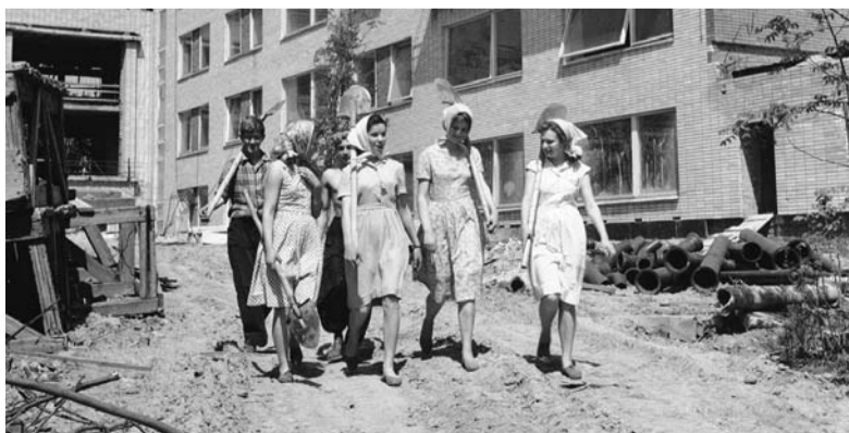
Бригада комсомольцев-школьников на строительстве Московского дворца пионеров. 1961–1962 годы.

С изменением статуса учреждения — от Дома пионеров к Дворцу пионеров — возрос масштаб его деятельности, возникли новые направления работы. Через годы прошли традиции ярких массовых мероприятий: Неделя игры и игрушки, Неделя детской книги. В наши дни к ним добавились конкурсная программа «Новые вершины», фестиваль национальных культур «Мой дом — Москва», зимний фестиваль снежных фигур «Битва снеговиков».